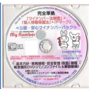
<マイナンバー安心パック>