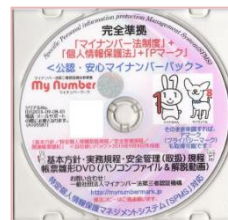
マイナンバー安心パック